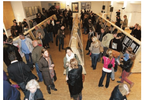
Tag Zwei: Reger Andrang auf der TDC-Show